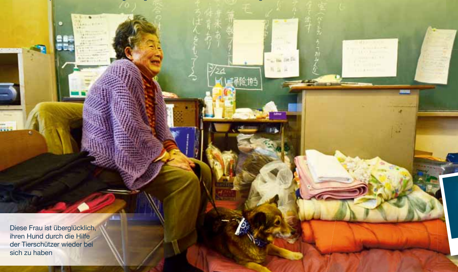
Diese Frau ist überglücklich, ihren Hund durch die Hilfe der Tierschützer wieder bei sich zu haben

Bis heute konnten allein Zehntausende Hunde und Katzen gerettet werden. Angesichts der prekären Situation der Haustiere werden die Hilfsmaßnahmen auf insgesamt 12 Monate verlängert. Am Ende der Hilfsmaßnahmen sollen alle Tiere wieder bei ihren Besitzern sein. Auch für die herrenlos gewordenen Vierbeiner werden wir ein neues Zuhause finden.