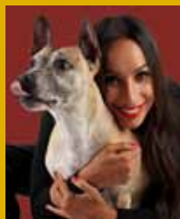
Sängerin Leona Lewis

Namensgeber der Kampagne sind die roten Halsbänder, denn jeder geimpfte Hund bekommt ein farbiges Halsband. So ist schon von Weitem erkennbar, dass der geimpfte Vierbeiner gesund ist und keine Tollwut übertragen kann.